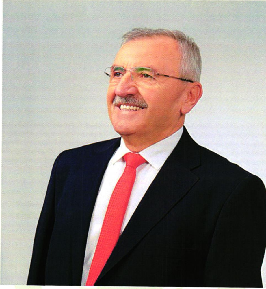
Enver APUTKAN Serik Belediye Başkanı