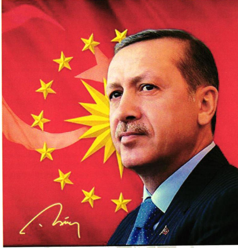
Recep Tayyip ERDOĞAN Türkiye Cumhuriyeti Cumhurbaşkanı