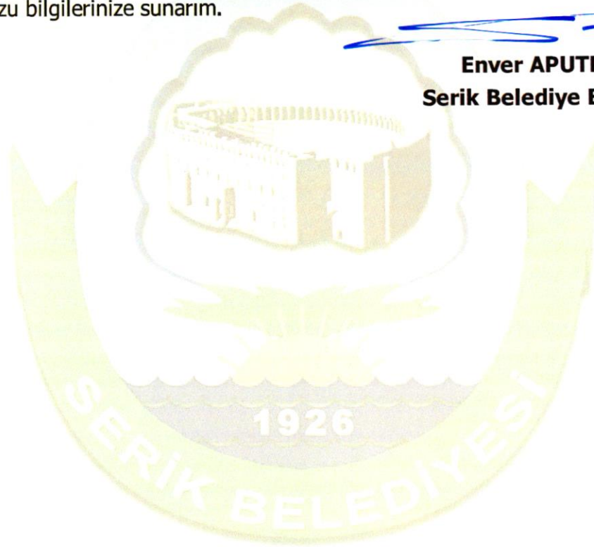
Enver APUTKAN Serik Belediye Başkanı

Bütün bu çalışmalarımızda emeğiyle, özverisiyle bizleri destekleyen çalışma arkadaşlarımıza, medis üyelerimize ve her koşulda yanımızda olan siz değerli hemşehrilerimize teşekkür eder, 2023 Yılı Faaliyet Raporumuzu bilgilerinize sunarım.